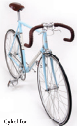
Cykel för renläriga...